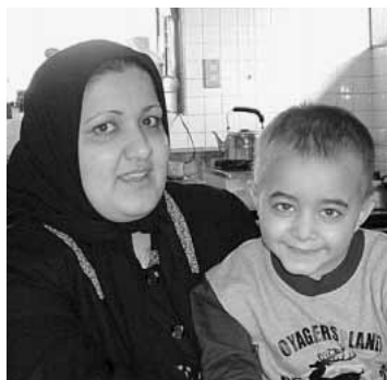
写真(下) 初めての外泊でお母さんと